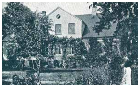
Gården Katrinebjerg 1905. Blev oprettet i 1858 af proprietær Otto la Cour.

På Bymuseets hjemmeside kan man læse ovenstående og meget andet om Christiansbjerg.