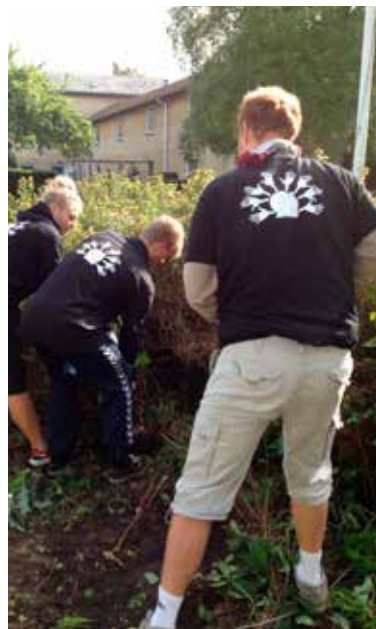
Christianskirken afviklede 21. september "En god dag" med praktisk hjælp i Christians sogn

Tolkning Der kommer deltagere i gudstjenesterne, som ikke forstår dansk. Der er etableret en mulighed for tolkning for dem.