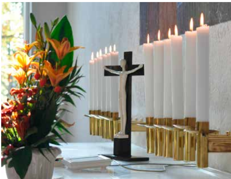
Christianskirken er glædens rum

På den måde er Christianskirken glædens rum for mig.”