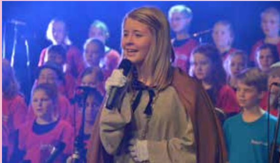
Der venter en stor oplevelse, når det store gospel-teenkor fra Aabenraa gæster Christianskirken

Få en anderledes gratis juleoplevelse for hele familien med Gospel-teens fra Aabenraa, der opfører julemusicalen: "Stjernen over Betlehem". Efter koncerten byder vi på et let måltid mad i kirkens krypt.