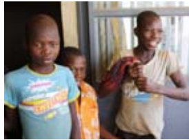
I efteråret samles der i Christianskirken ind til gadebørn i Vestafrika

I efteråret samles der ind til gadebørn i Cameroun og Nigeria, formidlet af Mission-Afrika og Afrika InTouch.